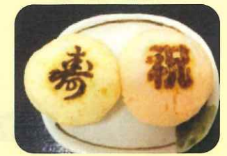
9/18 敬老の日 紅白饅頭