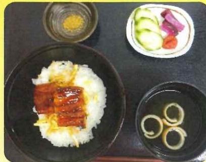
7/24 土用の丑の日 うな丼