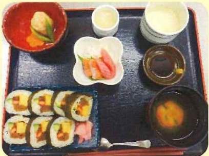
9/15 敬老の日 お祝い御膳