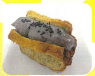
7/24 土用の丑の日 黒ゴマシフォンサンド