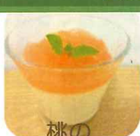
桃の パンナコッタ