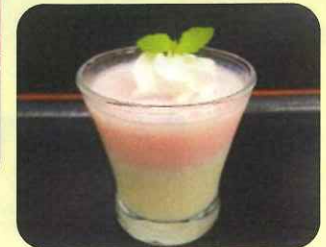
9/15 敬老の日 紅白パバロア