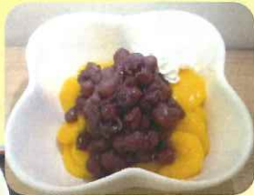
9/29 十五夜 お月見団子