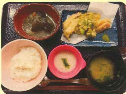
8/15 お盆 麦とろご飯定食