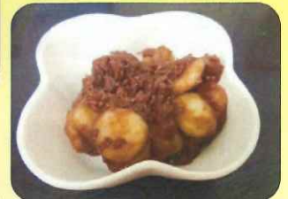
8/15 お盆 盆団子